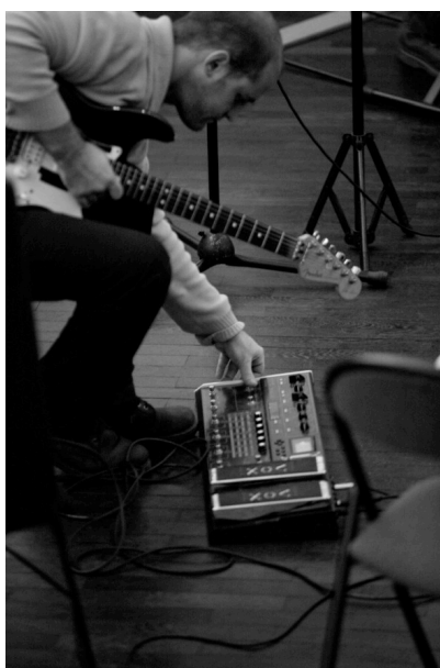
© Vincent ARBELET – PESM Bourgogne